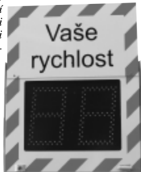
Právě dvě takovéto značky budou v obci instalovány

Dále chceme například zajistit plně vodorovné dopravní značení v obci, ale pouze v místech,