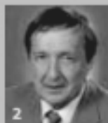
2 Antonín Podzimek náměstek hejtmána Sedlec-Prácheň