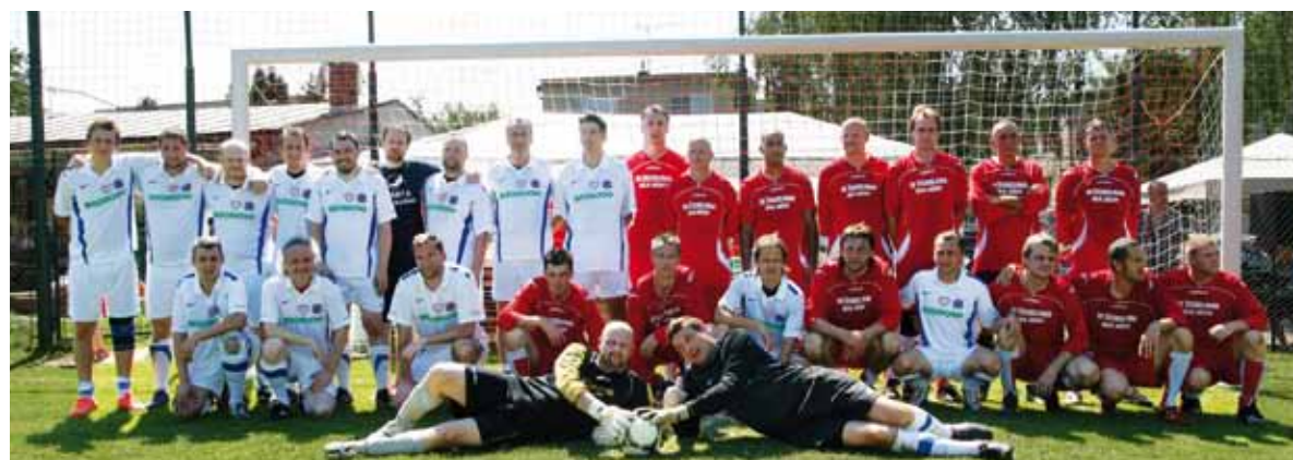
Real top Praha a B mužstvo Jirčany