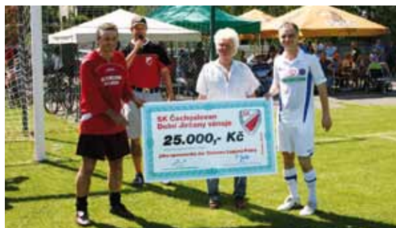
Předání šeku na charitu pro Domov Laguna Psáry

prken či filmových rolí – výběru Real Top Praha. Tady je nutno zmínit, že v poločase tohoto utkání došlo k předání šeku na částku 25.000,- Kč zástupcům Domova Laguna Psáry. Jednalo se o honoráře hráčů Real Topu, kteří toto startovné věnovali na charitativní účely. Den JIRČANSKÉHO FOTBALU pak završilo soutěžní utkání posledního kola sezony 2011/2012 SK Čechoslovan Dolní Jirčany vs. SK Pikovice. A přestože pak na hřišti fotbal skončil, dlouho do noci za hudebního doprovodu kapely Fishmeni pokračovaly nikdy nekončící diskuse o fotbale jako fenoménu, o tom jaký býval, jaký je dnes a kam se