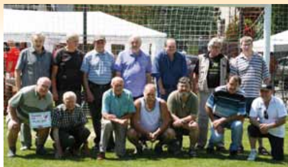
Naši zasloužilí – díky nim slavíme dnes 80 let

Oslavy zahájili úderem jedenácté hodiny naši nejmladší hráči, členové mladších a starších přípravek v dvojutkáni proti stejně starým reprezentantům ze sousedních Psár. Věkovým protipólem pak byl zápas našich „Old Boys“, kteří vzpomínali na své aktivní fotbalové roky ( mnozí ale kopačky provětrávají dodnes ) v duelu proti svým vrstevníkům z Libuše. Program pak svižně pokračoval napjatě očekávaným střetnutím našich nejzkušenějších hráčů proti hráčům známých hlavně z televizních obrazovek, divadelních