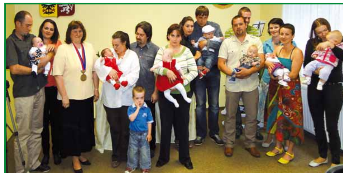
video z akce: MUDr. Jaroslav Sokol, kresby v pamětní knize: Martina Šmergllová