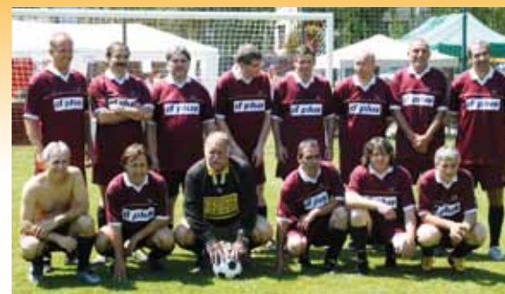
Jirčanská stará garda

posune v budoucnu a jak k tomu posunu přispějeme my, kteří fotbalu fandíme.