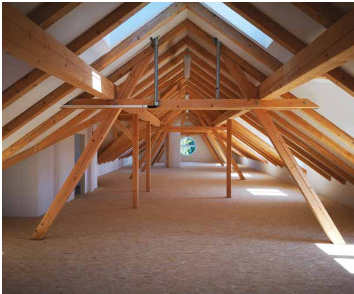
rekonstrukcí. Prostor prosvětlují i dvě zcela nová kulatá okna, která umně kloubí moderní a historizující architektonické prvky.