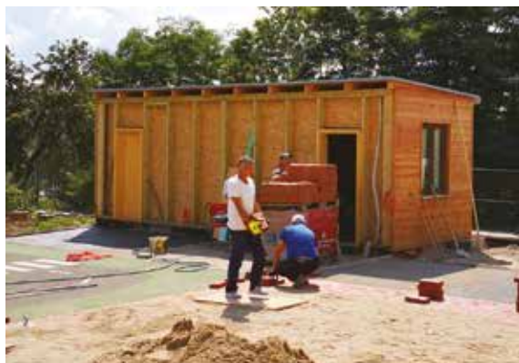
Venkovní altán bude schovávat před nepříznivým počasím vše, co se dětem při hrách hodí. Hračky na pískoviště, odrážedla, koloběžky, kočárky s panenkami, míče, obruče a mnohé další.