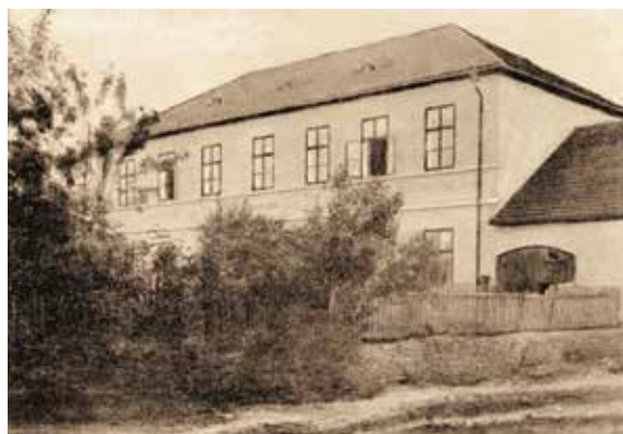
Při plánování rekonstrukce historické budovy, několikrát více či méně citlivě přestavované, jsme dlouho hledali to správné architektonické pojetí. Spolu s architekty jsme studovali historické fotografie a hledali způsob, jak skloubit staré a nové, jak respektovat dějiny i moderní trendy. Výsledek můžete nyní posoudit sami.