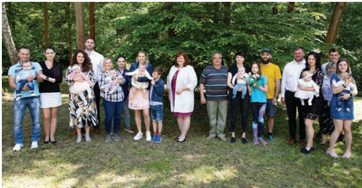
Foto z Vítání občánků najdete i na titulní straně