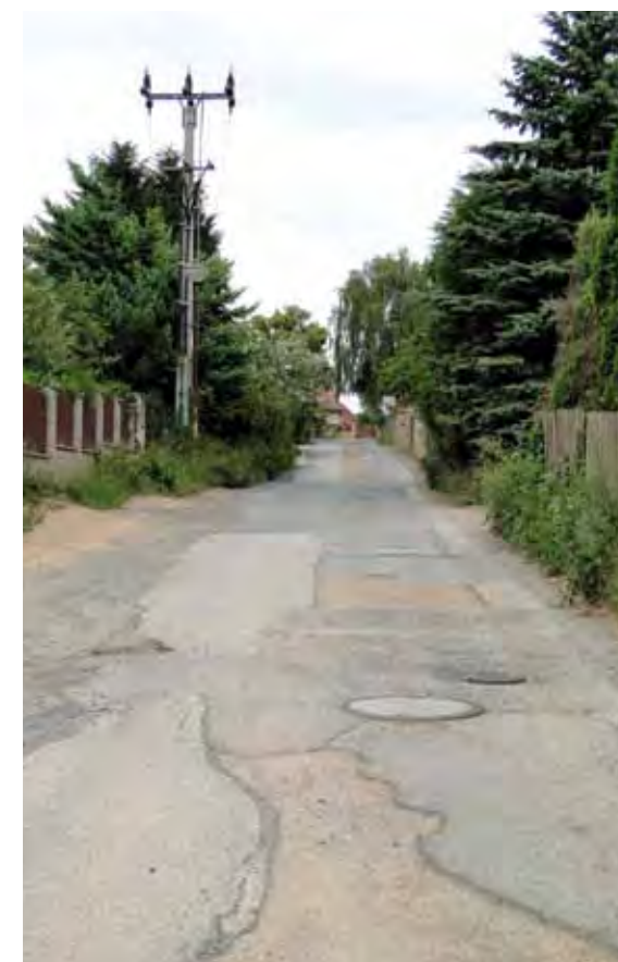
Dolnojirčanská před rekonstrukcí