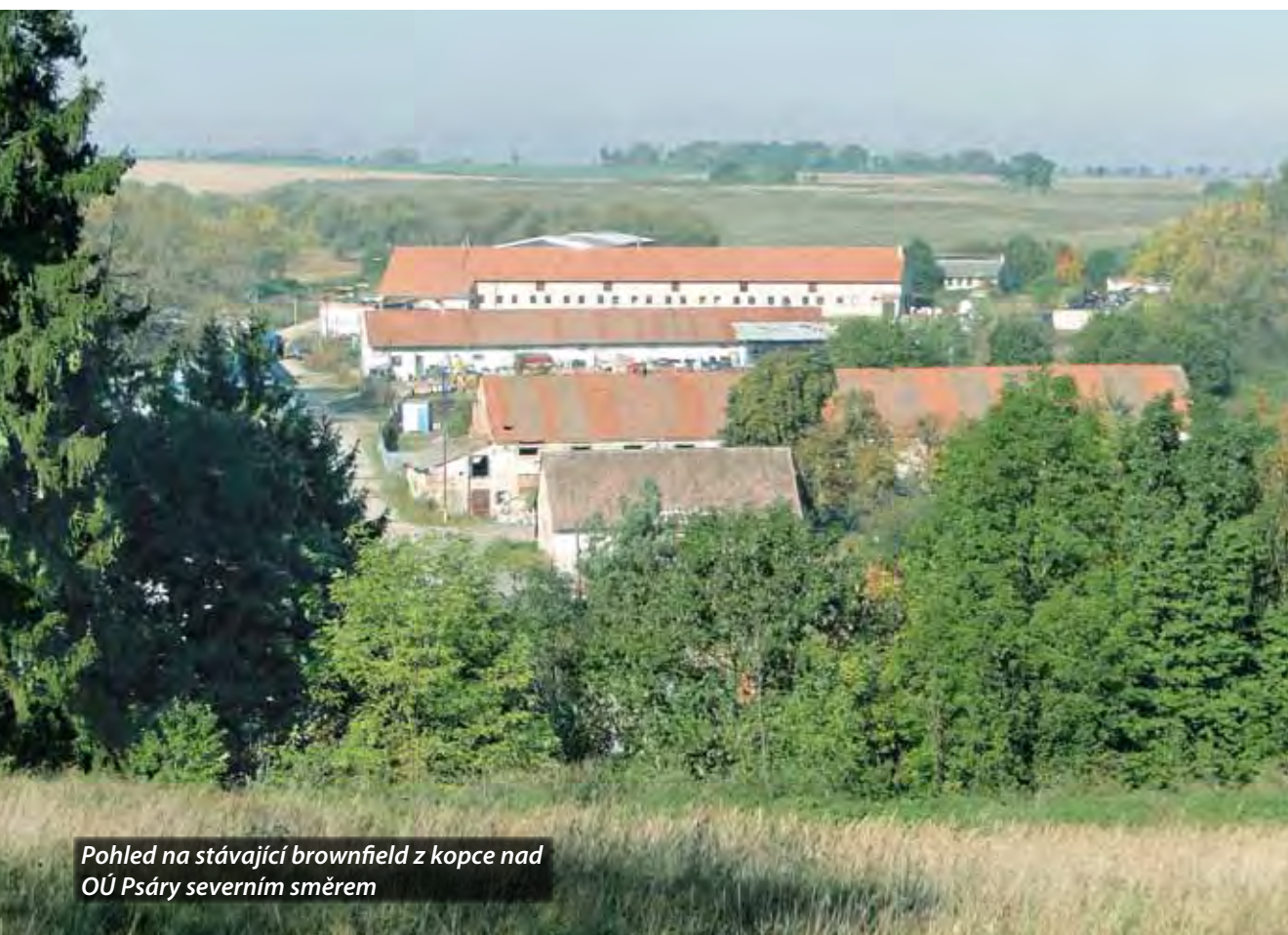
Pohled na stávající brownfield z kopce nad OÚ Psáry severním směrem

Obě stavby byly zkolaudovány dne 6. 10. 2011 Městským úřadem Černošice – odborem dopravy a odborem vodního hospodářství.