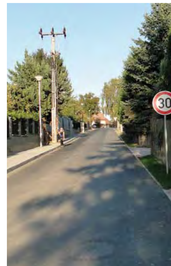
Dolnojirčanská po rekonstrukci