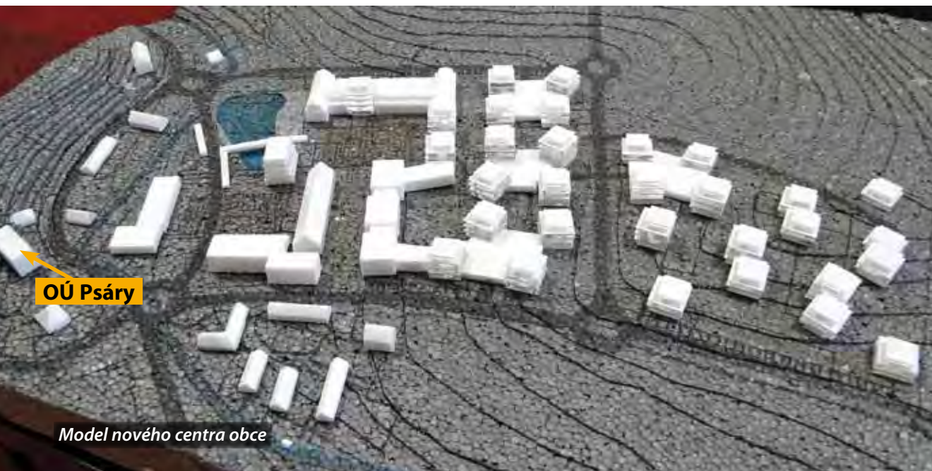
Model nového centra obce

Kolmá osa spojuje severní území obytných domů a sportovních a rekreačních ploch s atraktivitami umístěnými na jih od náměstí směrem k nové průjezdné dopravní tepně, zajišťující zásadní dopravní obsluhu centrálního území. Z náměstí prochází krytým chodníkem ( kolonádou ) přes nově navržené jezero ( odlehčující oddychový prostor zlepšující prostředí po stránce psychické i klimatické ), okolo frekventovaného nákupního centra ( kde se kříží a odkud se rozebíhají pěší komunikace i přepravní trasy, kde jsou obchody, tržiště, parkovací plochy a vše, co je k hospodářskému provozu centra zapotřebí ), až k zastávkám linkových autobusů na hlavní komunikaci, případně nově využitým plochám směrem k potoku. Dalším výrazným prvkem centra je i volně stojící dominantní objekt – kontrastní ke všem