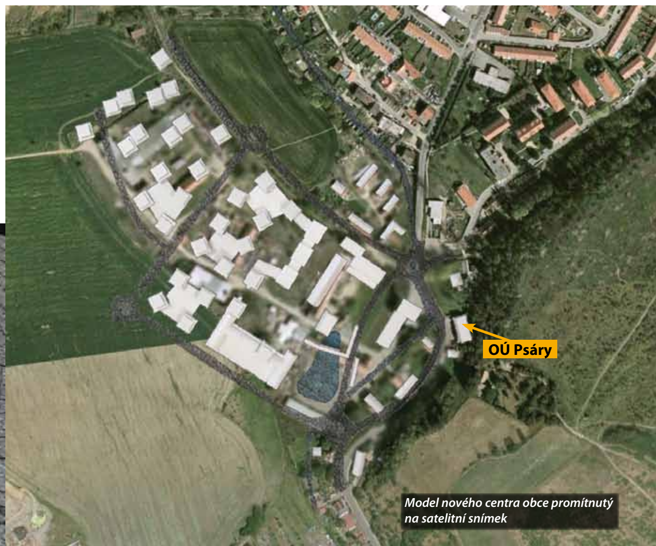
Model nového centra obce promítnutý na satelitní snímek