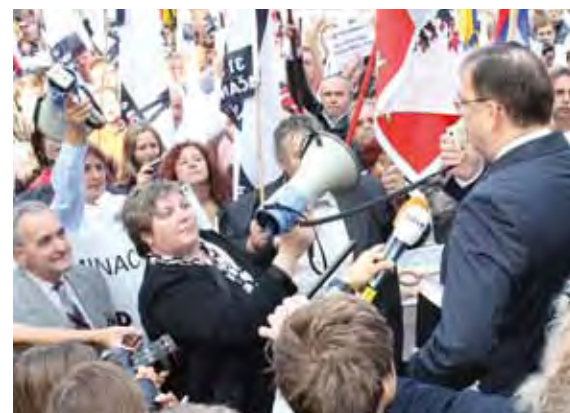
Demonstrace starostů na podporu novely zákona RUD dne 21. 9. 2011