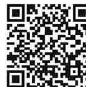
Platba přes QR kód

Nedoplatek, prosím, uhradte pod variabilním symbolem, do data splatnosti uvedeného ve faktuře, na účet dodavatele 10014-1703621/0100