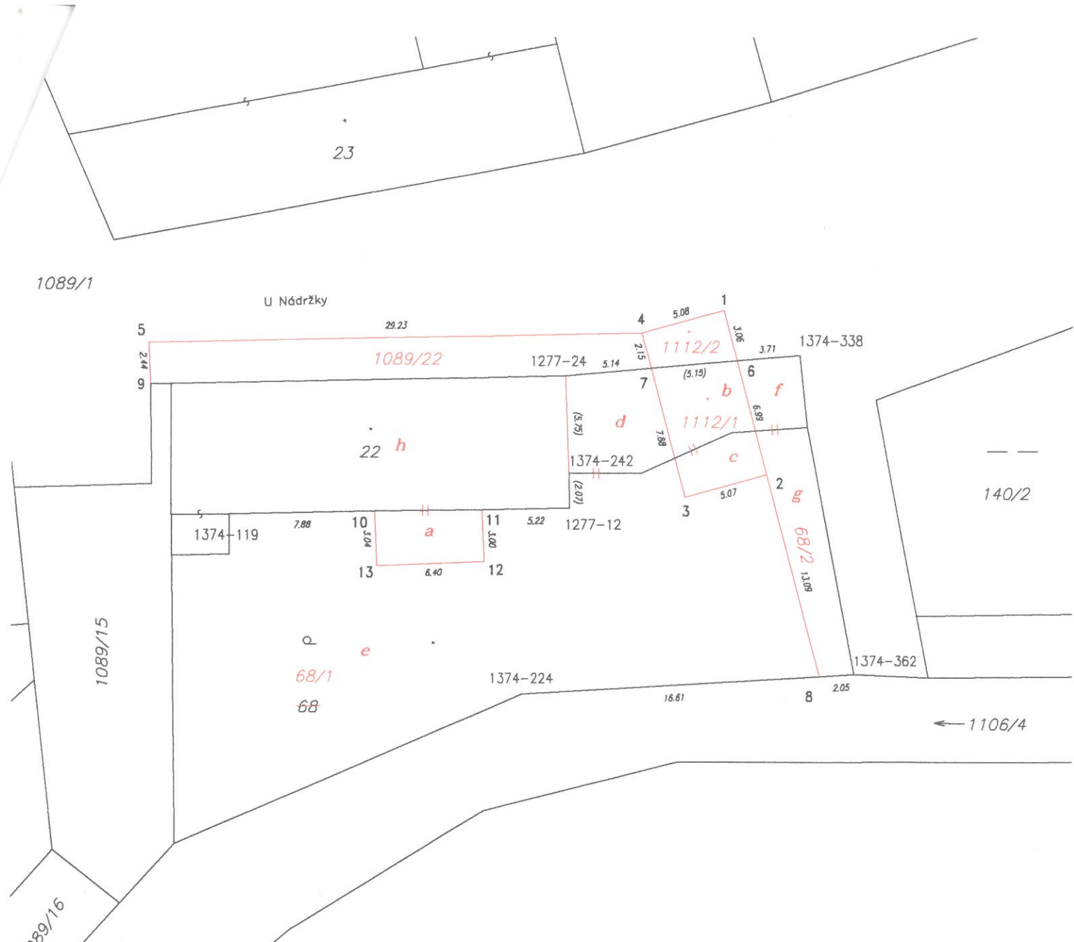
Seznam souřadnic (S-JTSK)