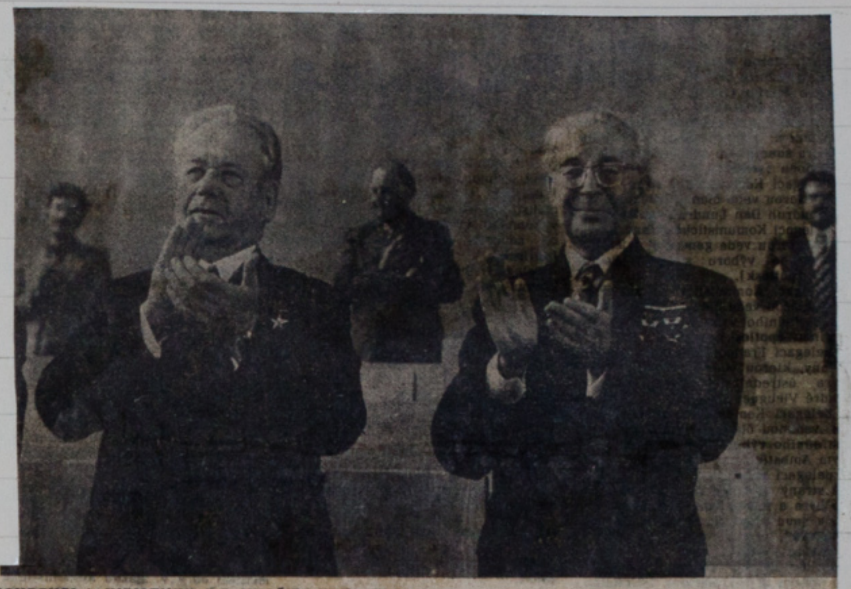
SOUDRUZI A. KIRILENKO A G. HUSÁK na tribuně sjezdu.

že naprostá jednotka násou bratrských stran, a na sjezdu vystoupil vedoucí delegace UV KSSS soudruh A. P. Kirilenko. Viz příloha č.